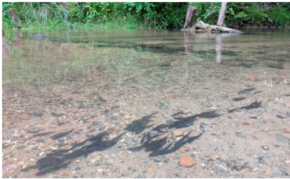
Junge Quappen direkt nach dem Besatz

Wir freuen uns auch jederzeit über Vereinsmitglieder, die uns an unserem Stand besuchen kommen!